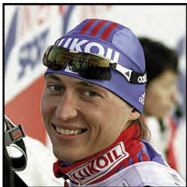
лыжник Александр Легков (файл 24),