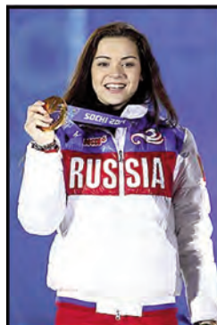
фигуристы Аделина Сотникова (файл 28)