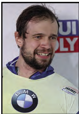
скелетонист Александр Третьяков (файл 25),