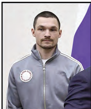
сноубордист Виктор Вайлд (2 золотые медали) (файл 26),